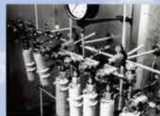
榊原開発による無水フッ化水素反応装置(ペプチド合成における脱保護に使用) HF-Reaction Apparatus by Sakakibara's development. (It is a safe cleavage strategy used in peptide synthesis.)