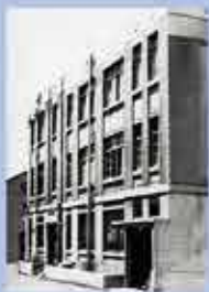
設立当初の大阪大学蛋白質研究所 (大阪中之島, 昭和33年) Institute for Protein Research, Osaka University in the beginning of the establishment. (Nakanoshima in Osaka, 1958)