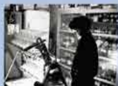
当時の大阪大学蛋白質研究所内での 研究風景 Research scene at the Institute for Protein Research, Osaka University during the opening days.