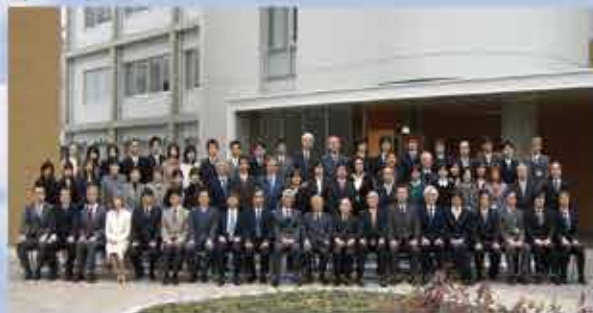
彩都研究所竣工記念(2007.1) Building Dedication Peptide Institute, Inc. SAITO Research Center(2007.1)