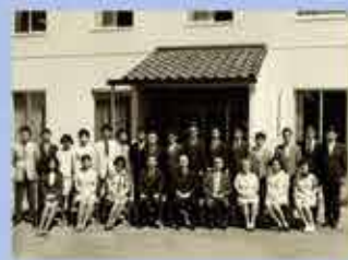
財団法人蛋白質研究奨励会竣工記念(1972.5) Building Dedication Protein Research Foundation(1972.5)

Peptide Institute, Inc. was established by concentrating the wisdom.